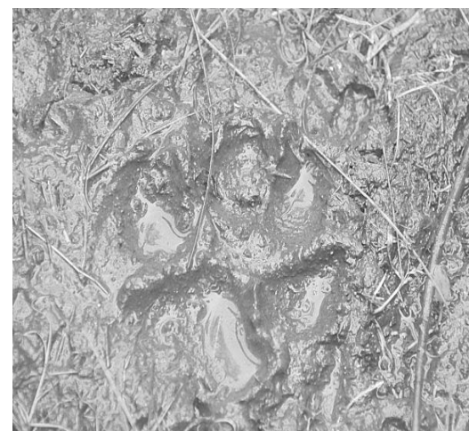
密歇根州泥土中的狼爪印。