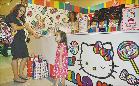
美国洛杉矶当代艺术博物馆 Hello Kitty40 岁生日活动现场

Hello Kitty 一直顺应着日本社会的发展。当日本青少年开始流行公开约会时,Hello Kitty 也交了一个叫作丹尼尔的男朋友。而当饲养宠物在日本女孩中风靡一时的时候,Hello Kitty 也拥有了一只属于自己的波斯猫“俾咪”。(张文静/编译)